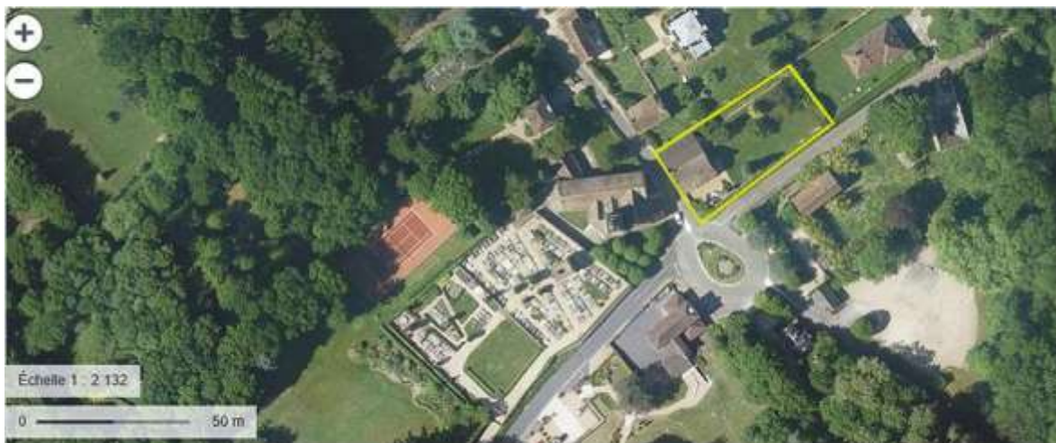
Vue satellite Géoportail de la propriété 2 rue de la Maison Forte et de son environnement proche

Une partie de la clôture du terrain entourant l'auberge sera retirée afin de lui redonner une ouverture et une visibilité à partir de la place comme cela était à l'origine