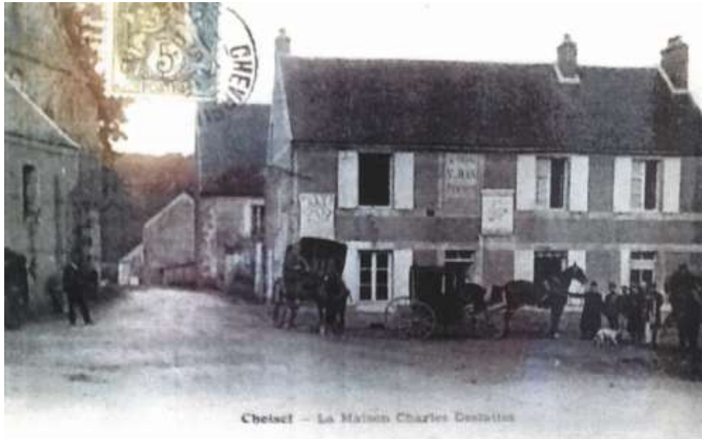
Ancienne Auberge 2 rue de la Maison forte (ancienne carte postale)

Le bâtiment se situe au cœur du bourg de Choisel au pied de l'église et à proximité de la mairie et de l'Espace Ingrid Bergman (ancienne mairie-école dédiée à la vie associative). Celui-ci a été une auberge jusqu'en 1965, date à laquelle il a été transformé en habitation.